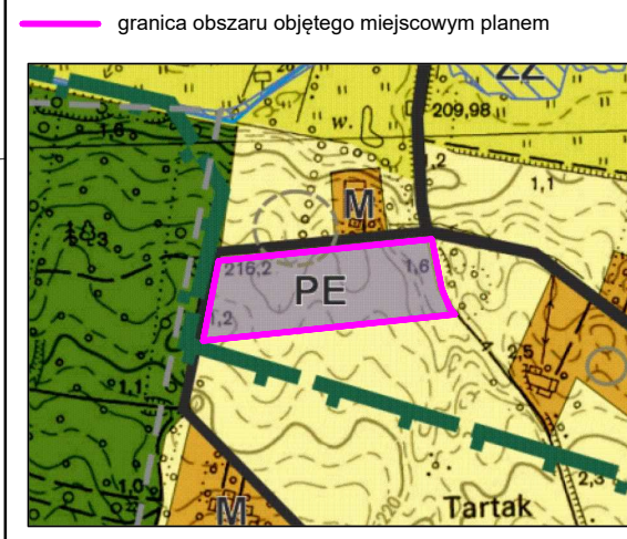
Wyrys ze Studium uwarunkowań i kierunków zagospodarowania przestrzennego Gminy Wojsławice przyjętego uchwałą Nr XXXVIII/200/22 Rady Gminy Wojsławice z dnia 26 kwietnia 2022 roku